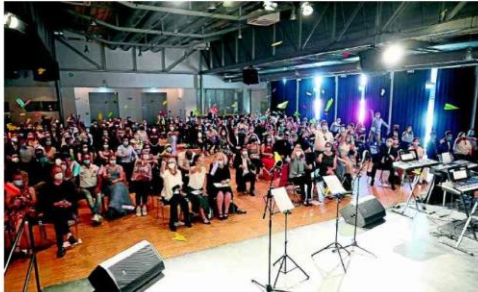
Tiefflieger aufgezogen: Die Bürgerhalle wurde kurzzeitig zur Flughalle, als die selbstgefalteten bunten Papierflieger mit besten Wünschen aus dem ganzen Saal auf die Reise geschickt wurden.