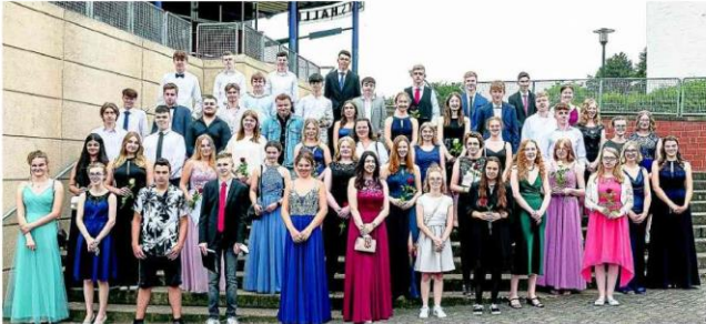
Die Klassen 10 c und 10 d der Käthe-Kollwitz-Schule konnten am Freitag ihre Zeugnisse entgegen nehmen. Die Feierstunde fand im Bürgersaal statt, das Foto entstand im Schatten der Ems-Halle.