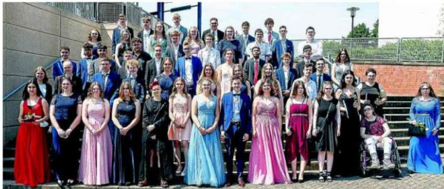
Kein Fake, sondern ein Realschulabschluss erwartete die Schülerinnen und Schüler der Klassen 10 a und 10 b der Käthe-Kollwitz-Realschule.